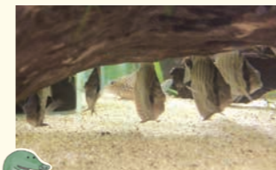
新しい仲間が増えました♪

● 受付ロビーの水槽に、アマゾン淡水魚ディスカスの幼魚が6匹加わりました。生後2~3カ月の彼らは体長が約5cm。姿が丸いことから、「ディスク」が語源になり「ディスカス」と呼ばれています。成長するにつれ綺麗な色へと変貌を遂げます。