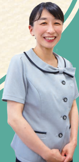
藤本病院 医事サービス課